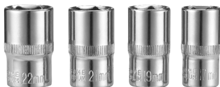
Вложки/Sockets: 17, 19, 21, 22 mm