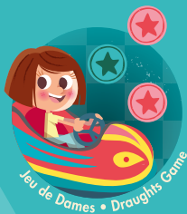
Jeu de Dames • Draughts Game