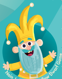
Nain Jaune • The Yellow Dwarf Game

Règles du Jeu • Rules of the Game Spielregeln