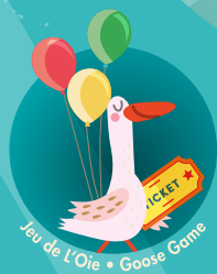
Jeu de L'Oie • Goose Game