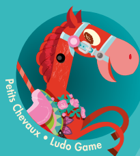
Petits Chevaux • Ludo Game